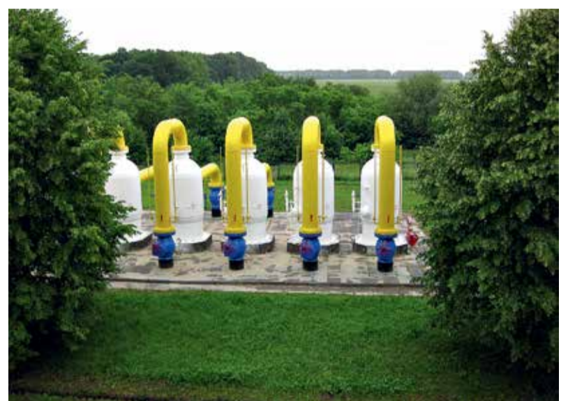
Блок очищення газу