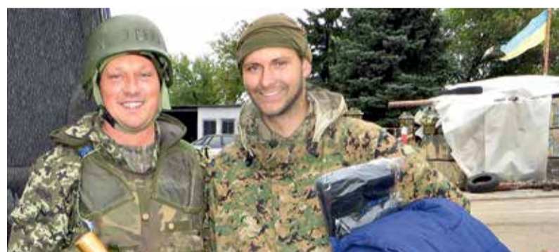
Бібрчани добровільно служать в зоні АТО