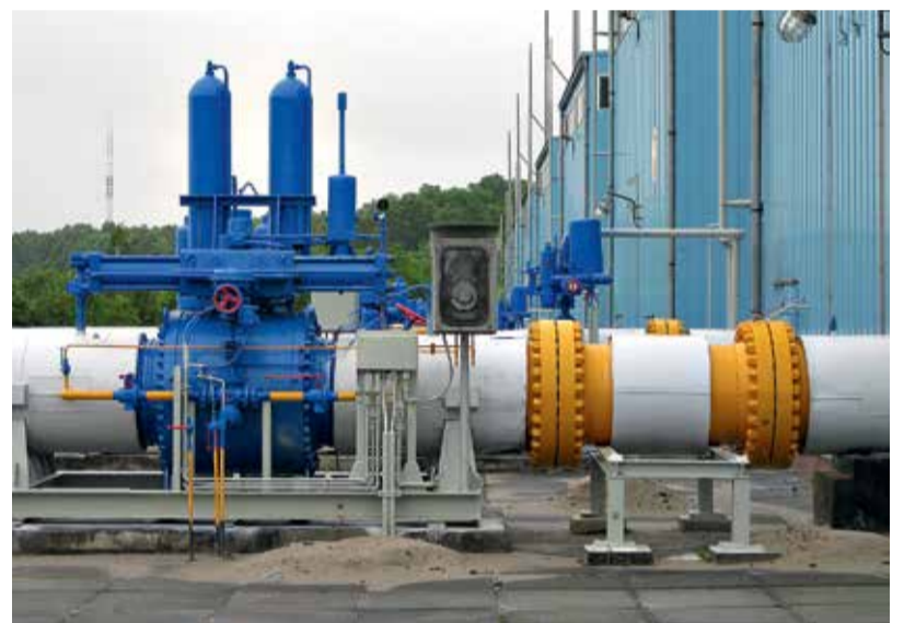
Один з елементів технологічної обв'язки ГПА