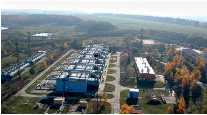
Компресорна станція «Бар»

Укртрансгаз розпочав активну фазу одного з найбільших інвестиційних проектів модернізації газотранспортної інфраструктури України – реконструкцію компресорної станції «Бар» газопроводу «Союз». За добу тут проходить понад 80 млн куб. м газу. І саме вона є головною під час транзиту блакитного палива до Європи