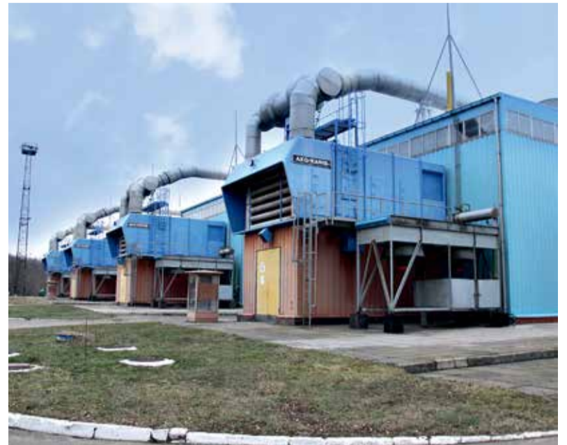
Газоперекачувальні агрегати станції

У рамках проекту реконструкції КС «Бар» заплановано заміну двох наявних газоперекачувальних агрегатів ГТК-10I (№1, 2) на сучасні – типу PGT-25-DLE виробництва компанії General Electric, що мають високі технічні, економічні та екологічні показники. Станцію оновлять блоком підготовки паливного газу для нових ГПА, новою системою генерації стисненого повітря з ресивером. Також передбачено