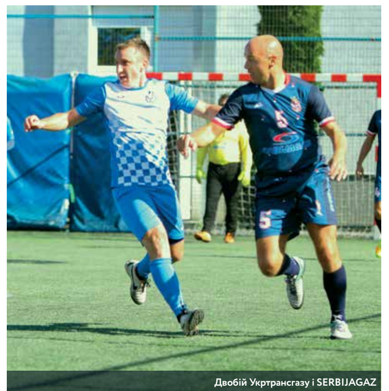
Двобій Укртрансгазу і SERBIJAGAZ