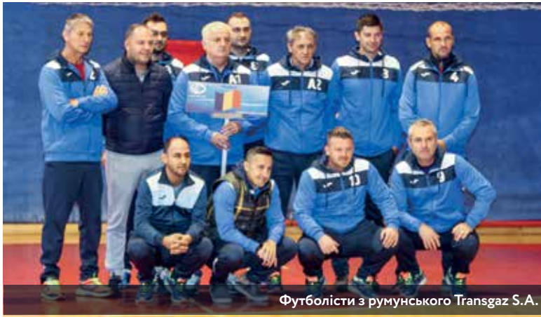
Футболісти з румунського Transgaz S.A.