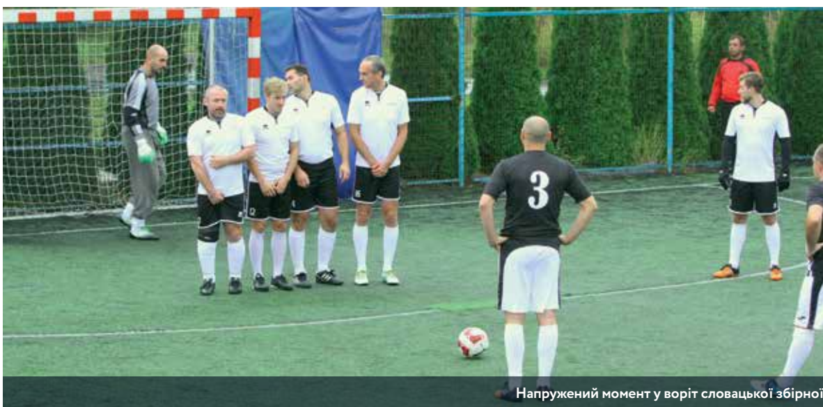
Напружений момент у воріт словацької збірної