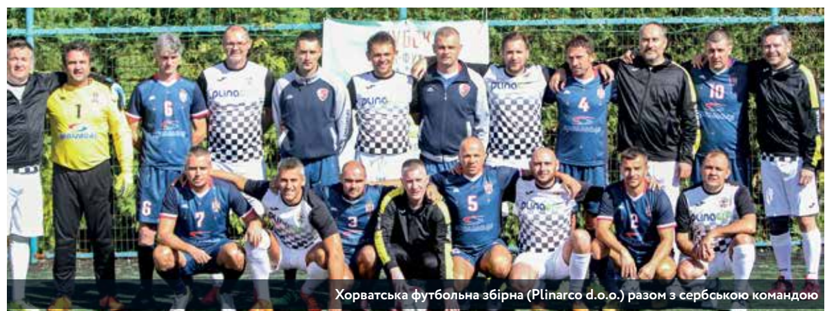
Хорватська футбольна збірна (Plinargo d.o.o.) разом з сербською командою