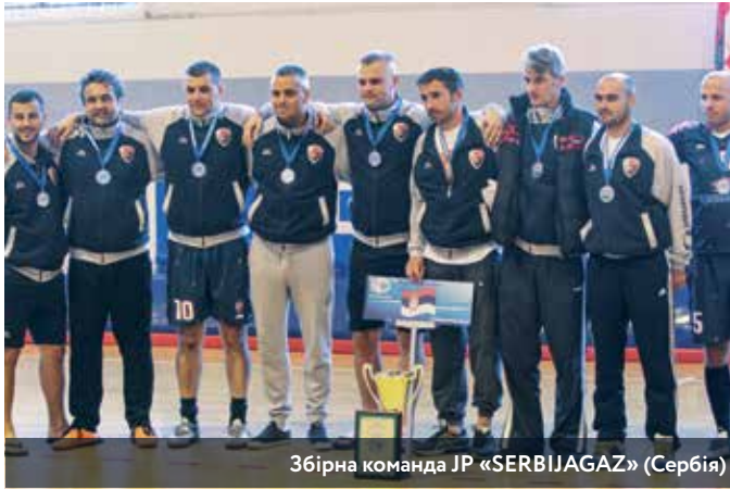
Збірна команда JP «SERBIJAGAZ» (Сербія)