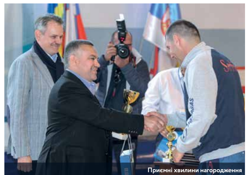
Приємні хвилини нагородження