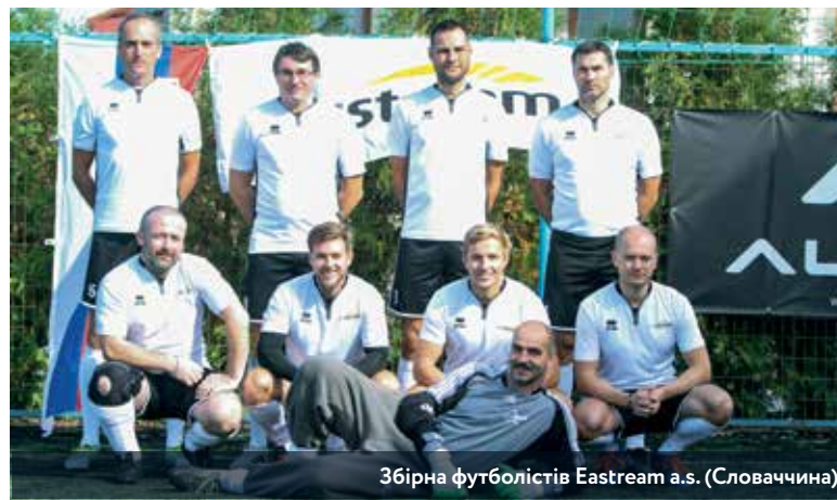
Збірна футболістів Eaststream a.s. (Словаччина)