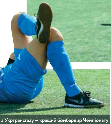
з Укртрансгазу — кращий бомбардир Чемпіонату