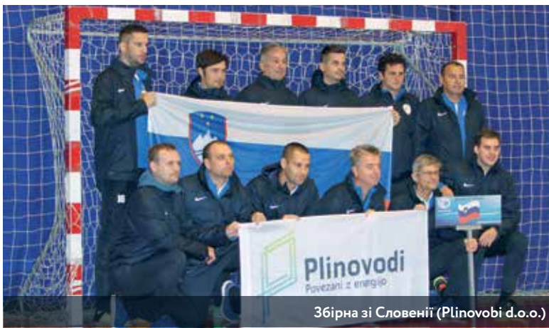
Збірна зі Словенії (Plinovodi d.o.o.)