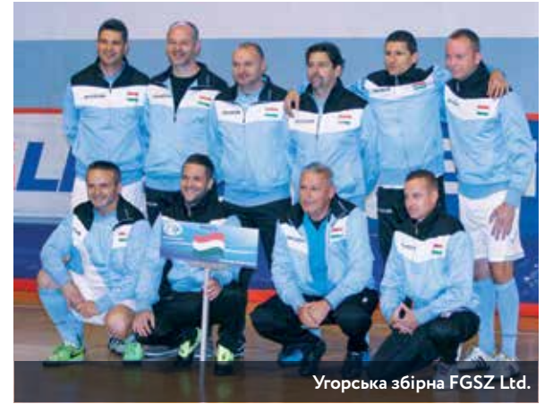
Угорська збірна FGSZ Ltd.