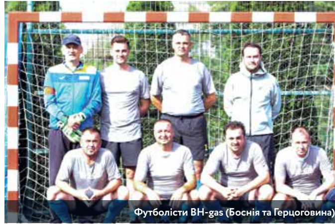
Футболісти Vih-gas (Боснія та Герцоговина)